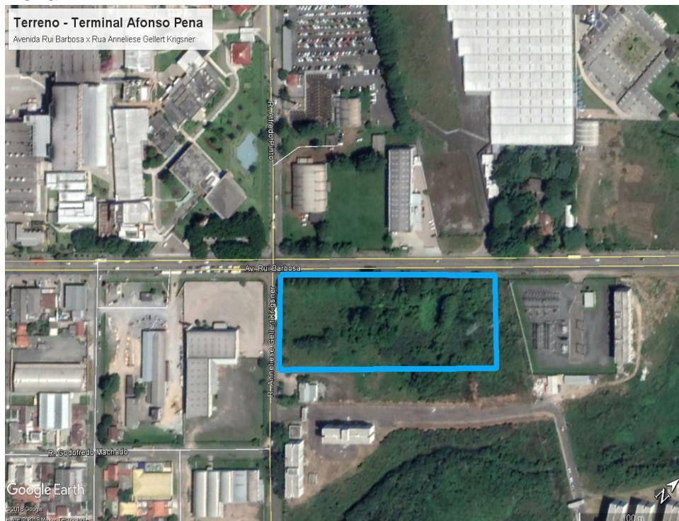
Figura 1 – Croqui de localização da área destinada à construção do Terminal Afonso Pena

O terreno para a implantação do novo Terminal de Ônibus Metropolitano Afonso Pena está situado à Avenida Rui Barbosa com a Rua Anneliese Gellert Krigsner, no bairro Iná, Loteamento Afonso Pena, no município de São José dos Pinhais, Paraná. O terreno possui ao todo 18.389,57m 2 , de propriedade do Município de São José dos Pinhais, com cadastro imobiliário Nº 1.083.823 e Matrícula 619300.