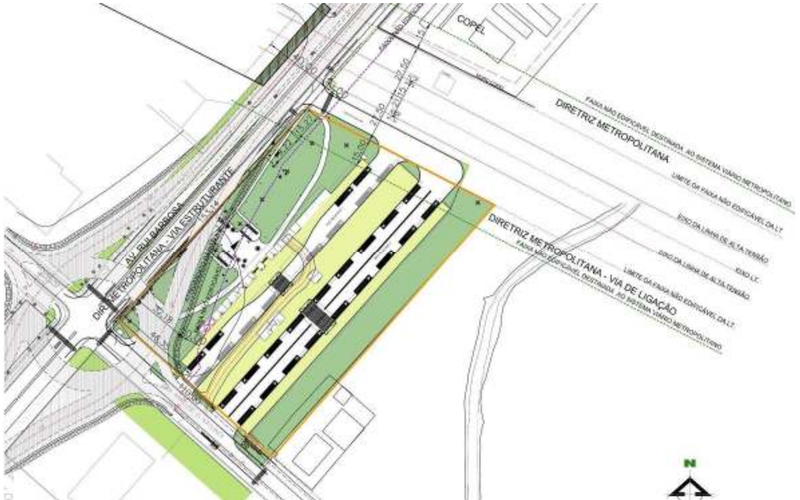
Figura 2 – Diretriz metropolitana que deve ser atendida na adequação e atualização dos projetos