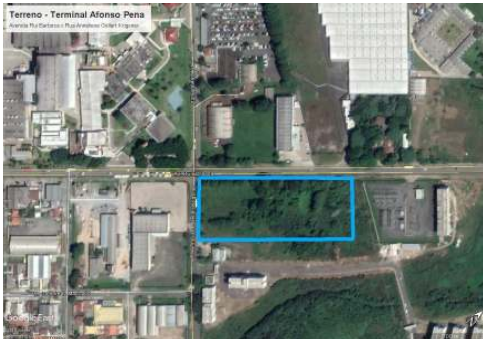
Figura 1 – Croqui de localização da área destinada à construção do Terminal Afonso Pena

O terreno para a implantação do novo Terminal de Ônibus Metropolitano Afonso Pena está situado à Avenida Rui Barbosa com a Rua Anneliese Gellert Krigsner, no bairro Iná, Loteamento Afonso Pena, no município de São José dos Pinhais, Paraná. O terreno possui ao todo 18.389,57m 2 , de propriedade do Município de São José dos Pinhais, com cadastro imobiliário N° 1.083.823 e Matrícula 619300.