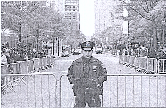
Ataque que deixou oito mortos ocorreu a quadras da local onde ficavam as Torres Gêmeas

missões de entrada criado para ampliar a diversidade da população do país. A medida foi aprovada com apoio de democratas e republicanos há 14 anos na administração de George W. Bush. Foi esse o ponto de partida de uma briga de Trump com o líder democrata no Senado, Chuck Schumer, no Twitter. "O terrorista entrou em nosso país por meio do Diversity Lottery Program" [Programa de Loteria da Diversidade], uma maravilha de Chuck Schumer", criticou o presidente republicano. Schumer rebateu os tuítes do presidente dizendo que "em vez de dividir o povo e politizar" a questão, ele deveria "fazer alguma coisa" e não cortar verbos para prevenção e combate ao terror. De acordo com investigadores, está claro que Saipov planejava o ataque há algumas semanas. Seis pessoas morreram no local do crime, a ciclovia ao longo da rua West, que margeia o rio Hudson, e duas perderam a vida no hospital - cinco argentinos, um alemão e dois americanos. Entre os 20 feridos, uma mulher teve as pernas amputadas e vários seguiram em estado grave. "De agora em diante, va-