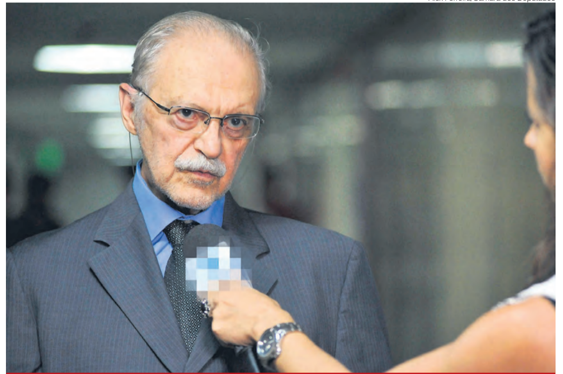
Protocolada no final de setembro, proposta de Mendes Thame (PT-SP) ainda não está na pauta de nenhuma comissão da Câmara dos Deputados

Os deputados ainda incluirão no texto uma emenda que prevê a punição de magistrados e integrantes do